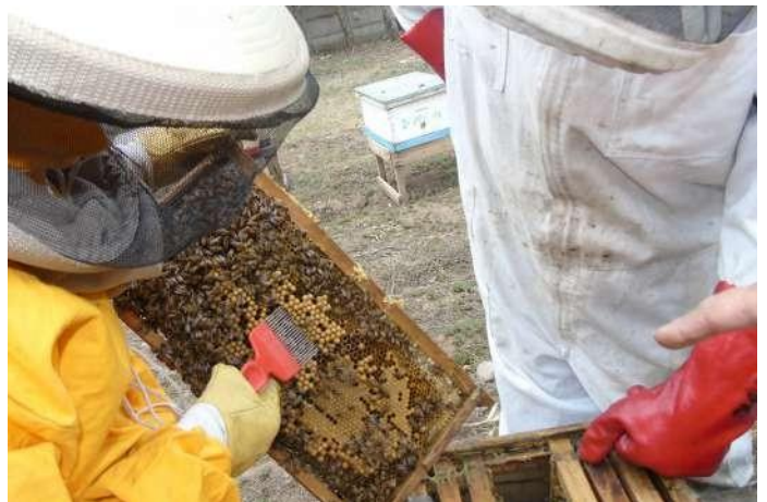
Diagnóstico de Varroa en crías de zánganos.