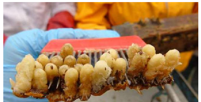
Varroa fundadora en pupa de abeja obrera.