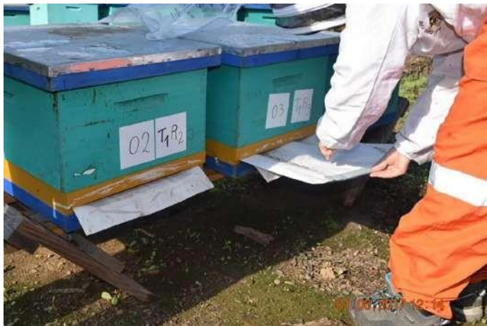
Observación de Varroas caídas en el piso de la colmena.