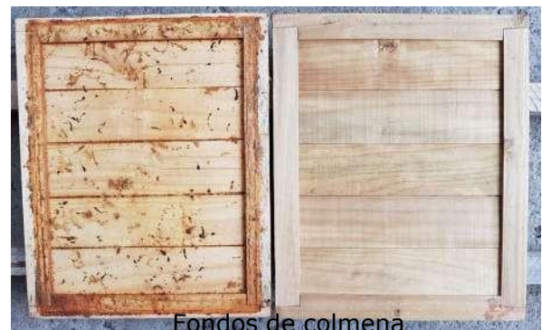
Fondos de colmena

Respuesta: Se prepararán 200 litros de solución, por lo que se deben restar a los 200 litros de agua, los 22 litros de formol (al 37%).