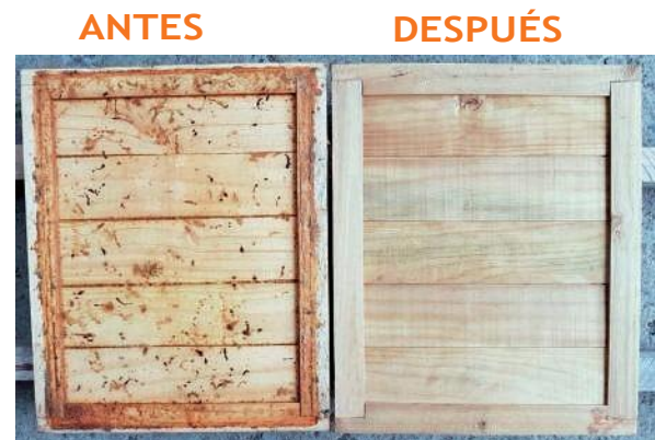
Fondos de colmena

Respuesta: Se prepararán 200 litros de solución, por lo que se deben restar a los 200 litros de agua, los 22 litros de formol (al 37%).