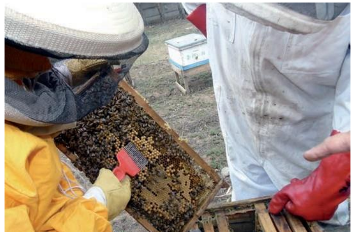
Diagnóstico de Varroa en crías de zánganos.