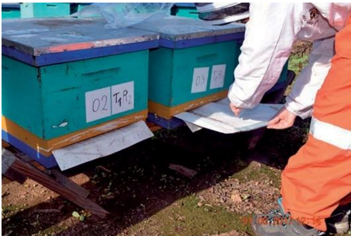
Observación de Varroas caídas en el piso de la colmena.