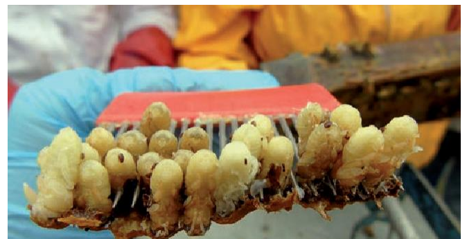
Varroas fundadoras en pupa de abeja obrera.