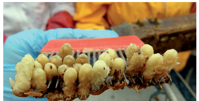
Varroas fundadoras en pupa de abeja obrera.