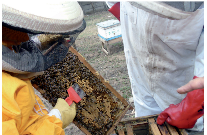
Diagnóstico del ácaro Varroa en crías de zánganos.