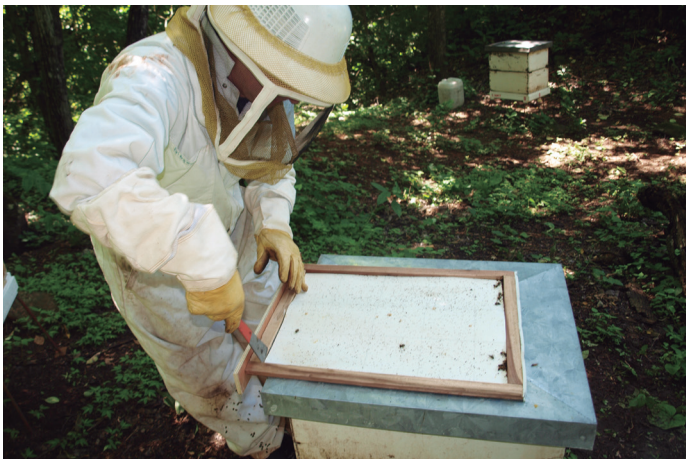
Observación de ácaros caídos en el piso de la colmena.